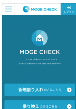
モゲチェックのトップページ

金融機関に申し込む前に住宅ローン借り入れの一般的な条件が想定できる、ユーザーの信用力を客観的に測る基準(信用スコア)「モゲスコア」を2017年1月に開発しました。このたび、この機能を更に進化させて全国140金融機関の融資確率を個別に推定できる機能をモゲチェックに本日追加しました。これにより、ユーザーは審査に通る可能性が高い金融機関から借入条件がよいローンを選ぶことが可能となります。