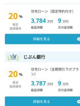
融資確率付きランキング画面