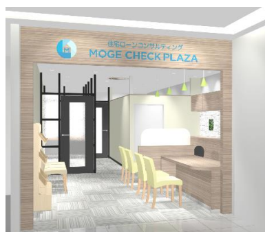
モゲチェック・プラザ横浜入口イメージ

MFS は、「モゲチェック・プラザ」開設以降延べ約 500 人のお客様が来店、約 250 人約 50 億円の契約金額を達成しております。これまで「モゲチェック・プラザ」には、東京を中心に神奈川・千葉・埼玉からも来店するお客様が数多くいたことから、本出店により神奈川エリアのお客様の利便性向上を図ります。