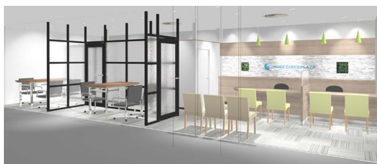
モゲチェック・プラザ横浜店内イメージ

昨年2月に導入されたマイナス金利によって、住宅ローンの借り換えニーズがさらに高まる中、引き続き借り換えコンサルティングサービスは利用者数が増加しています。また、本年1月25日から借り入れコンサルティングサービスも開始し、モゲチェック・プラザは借り換え・借り入れの両方に対応できるようになったため、今後は借り入れ相談のお客様はさらに増えると想定しています。そのような中、郊外にお住まいのお客様のニーズにお応えするため、この度横浜にオープンすることに致しました。今回の「モゲチェック・プラ